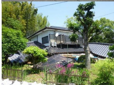
写真1 熊本地震における益城町の被害