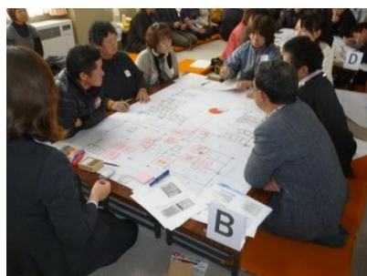
写真2 防災学習でのHUG実施例