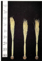
原麦「きたいふき」「はやまさり」「ハヤカゼ」