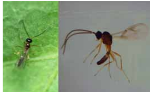
ギフアブラバチの成虫