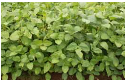
観察適期の大豆 (30株全葉を調査)