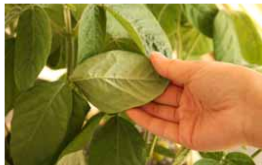
葉をめくって葉裏を観察