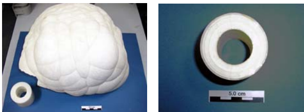
写真1 左側：巨大に成長した温泉スケールと管内部に付着した温泉スケール 右側：管内部に付着したスケールには、成長に伴う年輪状の縞模様が見られる（神恵内温泉998）

温泉に入ると、浴槽のまわりや注ぎ口に白色や褐色の硬い物質が付着しているのを見たことはないでしょうか（写真1左）？これが「温泉スケール」と呼ばれるもので、温泉に溶けている成分の一部が、温度や圧力の変化にともなって、水に溶けない物質として析出したものです。一般には「湯の花」とも呼ばれ、採取したものが、温泉地などでよく売られています。