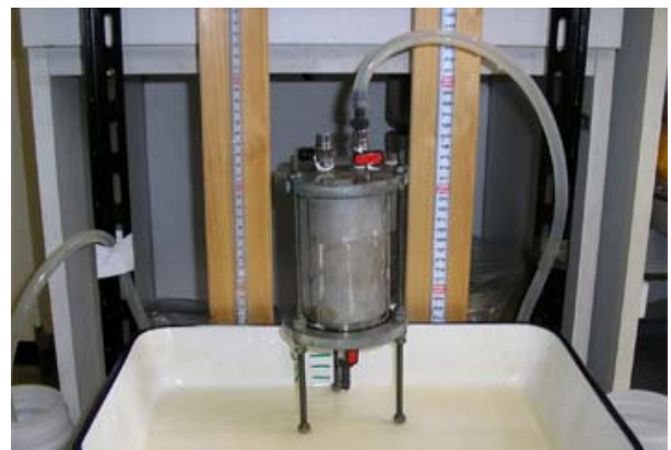
写真 2 室内透水試験のようす

※相対的の海水準の変動に対応して地層がどのように形成されたのかを成因論的に解釈する手法