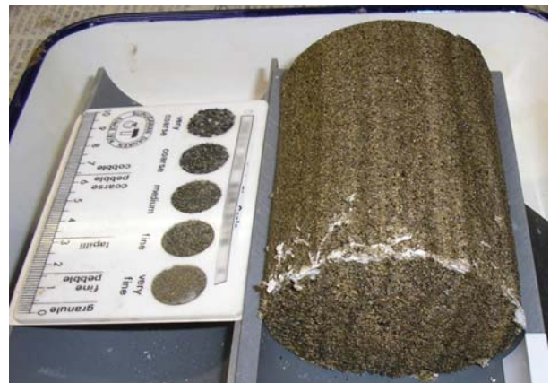
写真 1 不攪乱試料の例。平行葉裏（地層中にみられる平行な模様）の発達した中粒砂（十層勝平野に分布する池田層群最上部）

この透水性の測定から、地層の種類（地層のできた環境や営力）によって、透水性の良い地層と悪い地層をある程度分類できることが分かってきました。今後は、試料や測定の個数を増やし、より正確な「堆積学的解析による地層の評価」と「実際の地層の透水性」を組み合わせた帯水層評価手法を提案していくことを目指しています。（水理地質科）