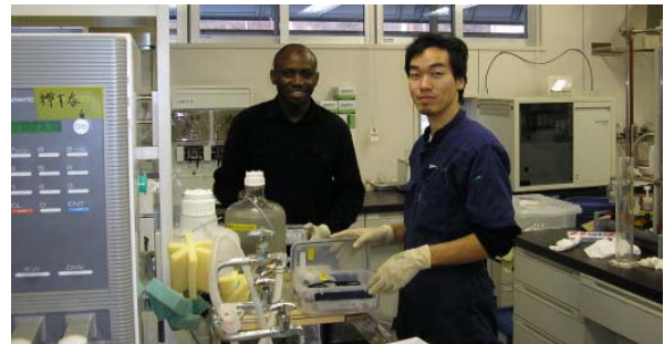
実験室で作業中の2人

二人が立派な業績を上げ、社会に巣立ってからはわが国の内外あるいは母国で活躍してくれることを期待したいと思います。(海洋開発科)