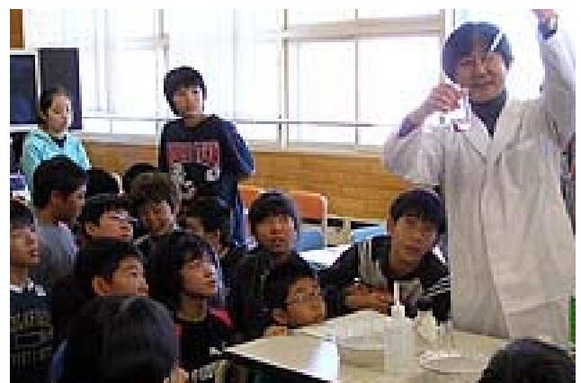
中和滴定の実演をみつめる児童達