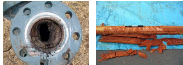
写真2 左側：管の内側に付着した温泉スケール 右側：管の外側に付着した温泉スケール

は、管の内側外側を問わず、徐々に付着・成長し、温泉の流れの妨げとなります。温泉スケールは、その成分によって、炭酸カルシウム質、鉄質、硫黄質、珪酸質に大きく分類することができますが、多くの場合は炭酸カルシウム質です。炭酸カルシウムは酸に溶けることから、塩酸を用いてスケールの付着を抑制している温泉もあります。