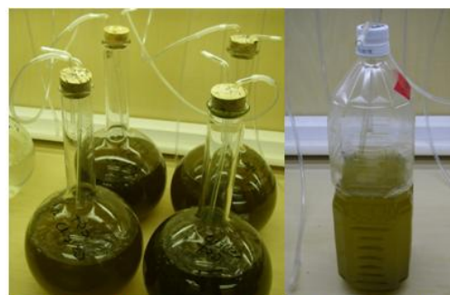
写真3 キートセラスのフラスコ培養(左)とペットボトルを用いた培養

一方、大量に種苗を作る設備を持たない機関の場合、幼生飼育で必要になる餌の量は少なくても済みます。例えば 10 万個体を育成しようと思えば、必要な濃縮キートセラスの量は先述の 1/10 の 15ml で済むことになります。以前は、ガラスのフラスコを用いていたキートセラスの培養ですが、最近になりペットボトルでも培養できるようになっています(写真 3)。蛍光灯の光と栄養塩と通気と種(株)が揃えば、特に専門的な知識が無くても餌料を培養することができます(詳細は誌面の都合上また別の機会に紹介します)。近年のマナマコの種苗生産への関心の高まりに答えるため、これからも様々な開発・改良を目指します。