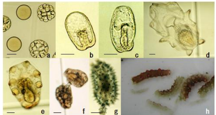
写真1 マナマコの成長

幼生が絶食に耐えられる期間を明らかにできれば、十分な幼生数を確保できるまで餌の発注を遅らせたり、早く生まれた幼生と遅く生まれた幼生を一緒に育て、餌と給餌育成作業が削減できるはずです。