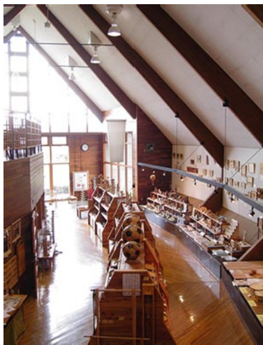
写真2 情報館の製品展示の様子

また、この情報館自体もカラマツ大断面集成材を採用した、木材を多く使った建物です。建設されて20年以上になりますが、いまだに古さを感じさせず、木材をうまく使えば長く使うことができることが分かる建物であると思います。