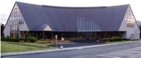
写真1 木と暮らしの情報館

A: 最近、地球温暖化対策や地域材の利用促進の方針などから木材を使おうとする機運が高まっています。林産試験場「木と暮らしの情報館」(写真1)では、北海道の企業で製作・販売されている優れた木工クラフトや、建設資材などの木材製品・情報、林産試験場で開発された成果などが展示してあり(写真2)、暮らしの中に木を使うことのすばらしさを具体的に提案しています。北海道の木材製品の良さに触れて、生活の中に木を取り入れて、その温かさや優しさを感じて、木材を身近に使っていただければと思います。