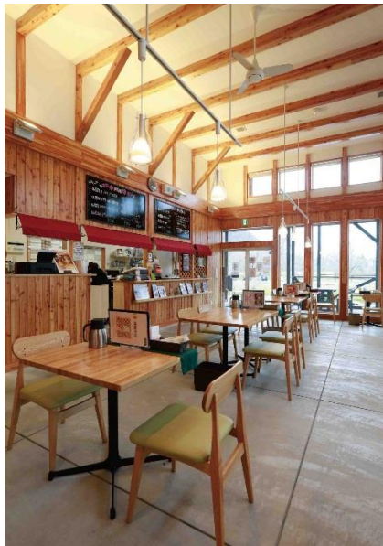
【釧路町地産地消センター】