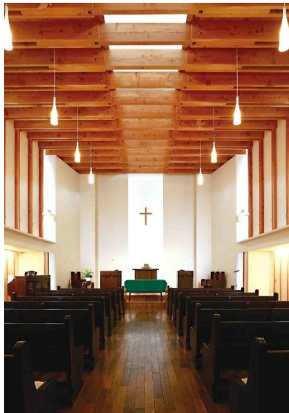
【日本キリスト教団 小樽教会】