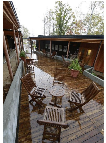
【大雪 森のガーデン】