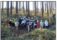
地材地消バスツアー