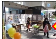
地材地消パネル展