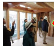
カラマツ住宅 H26年築(幕別町)