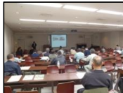
エコ住宅セミナー