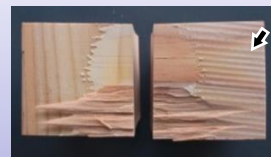
写真5 接着不良箇所の接着層 塗布ローラーの跡(矢印)から、接着剤が押し延ばされていないことがわかります。従って、これは、ラミナ同士の密着が不十分で生じた接着不良だと考えられます。