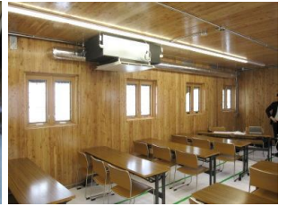
写真1 林産試験場で試作した道産カラマツCLT