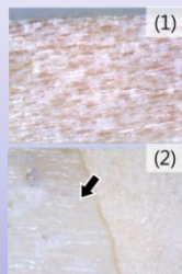
写真6 剥離箇所の接着層の顕微鏡写真 (1) 木材, (2) 接着剤に破壊の形跡はないことから、十分に接着されていなかったことがわかります。また、木材繊維の跡(矢印)があることから、ラミナは密着したものの接着剤は十分に転写されなかったと推察されます。つまり、圧縮時には接着剤が乾燥・硬化していたために接着不良(乾燥接着不良)が生じたと考えられます。