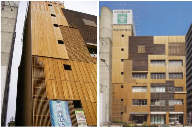
写真1 大阪木材会館