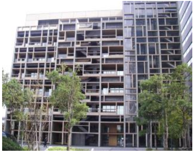
写真2 東京木材会館 その1

今後、このような建築物は環境負荷の側面や意匠性付与の観点から増えていくものと思われます。