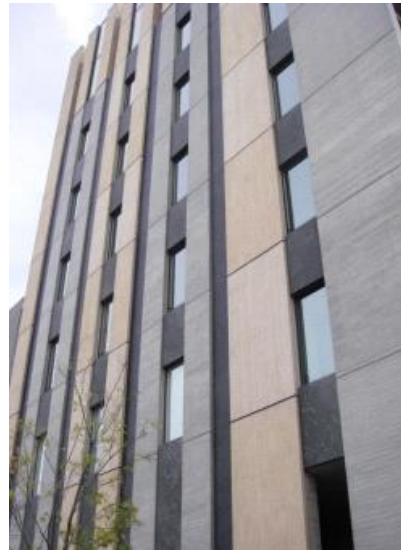
写真3 東京木材会館 その2