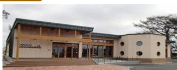
むかわ町放課後子どもセンター