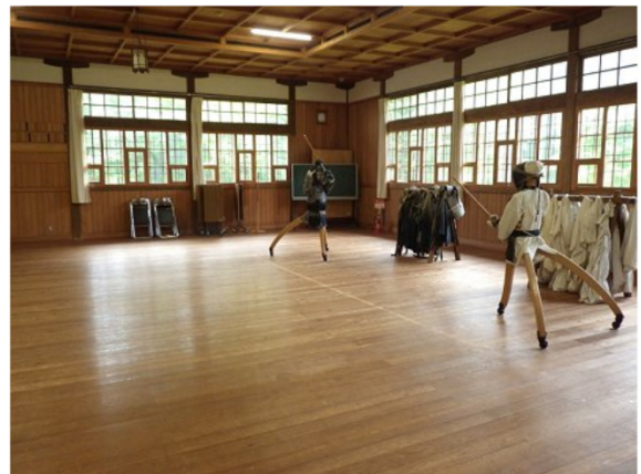
写真1 使い込まれた剣道場の床事例 (旧北海道札幌師範学校武道場の剣道場)