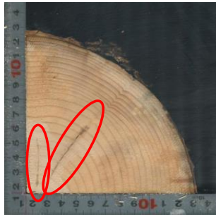
写真1 1年輪分だけの割れ 写真2 2年輪分以上の割れ