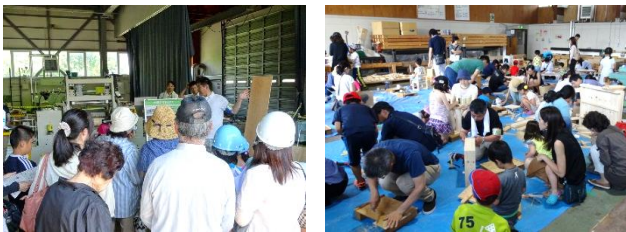
【木になるフェスティバル(2016年)より】

○木になるフェスティバル（7月29日（土）9:30～15:00）では、林産試験場を一日開放して、木に関する科学体験や、工作、木っ端市、場内見学会など盛りだくさんの催事を行います。