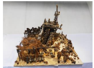
【木工作品コンクール展(2016年)より】