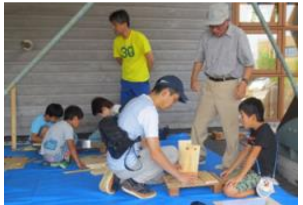
写真8 指導員による工作教室

特にキャットタワーは、ペットのネコも家族として大切にされていることが伺える作品で、木工を通じて家族の絆を深めるイベントであるとあらためて感じました。