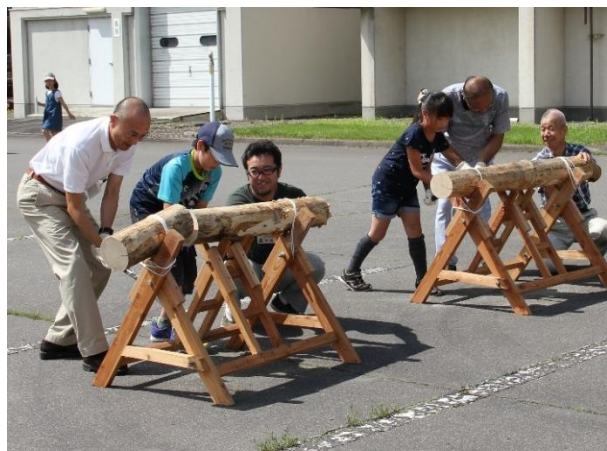
写真1 開会式の丸太カット