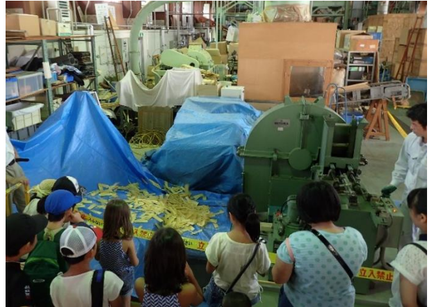
写真4 シェービングマシンの実演