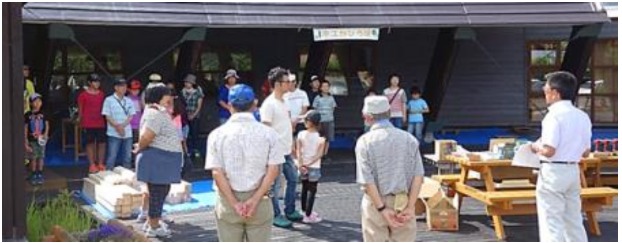
写真7 木工作ひろばの開会式の様子

用方法や木工の基礎について説明を受けた総勢27名の参加者が思い思いに作品を製作しました(写真8)。