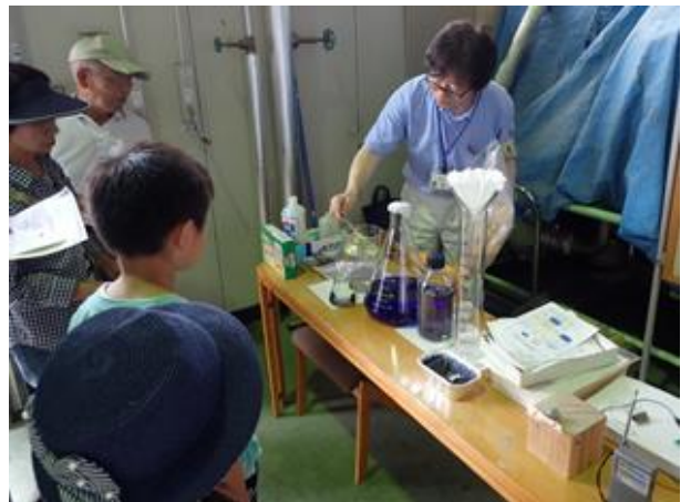
写真5 木炭を使用した実験