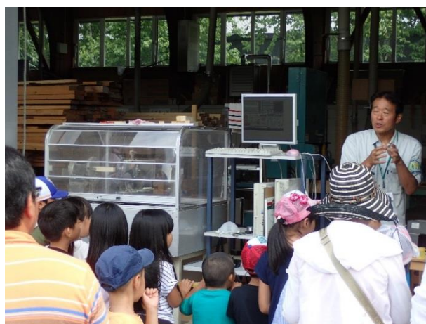
写真3 CNC木工旋盤の実演