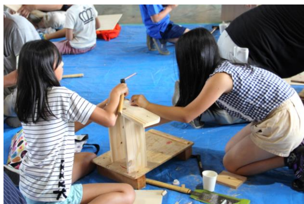
写真2 木工作体験の様子