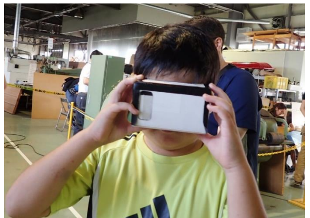
写真6 VRによる工場見学の様子