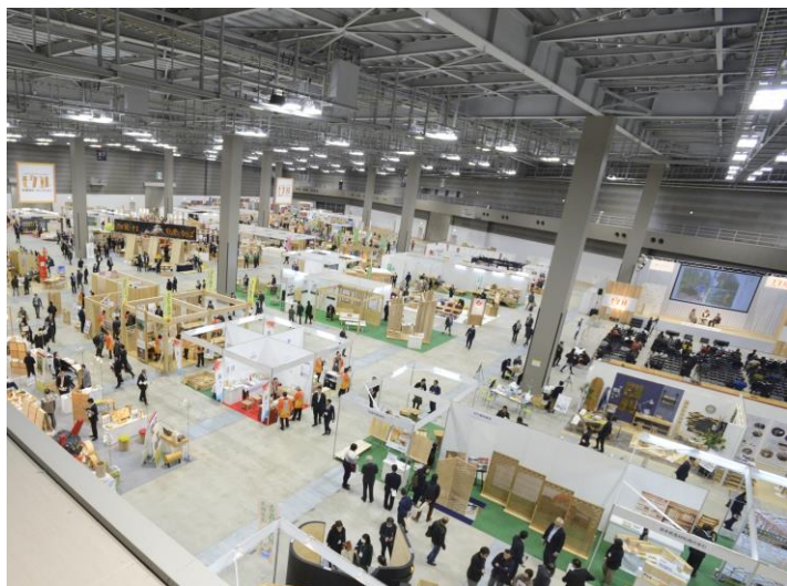
モクコレ会場の様子

北海道ブースでは、乾燥技術により、狂いや内部割れを克服したカラマツ無垢構造材、準不燃・難燃処理が施された道南スギ壁材や斬新なデザインが高く評価されている床材などの内外装材のほか、国内外で高く評価されている北海道の家具、木雑貨や楽器、トドマツ精油を使った空気浄化剤に至るまで、道産木材を活用して製作されたさまざまなジャンルの木製品を展示し、また「北海道産木製品リスト」の配布も行うことで、道外の建築関係業者や商社・流通業者等に対し、道産木製品の魅力をPRしました。