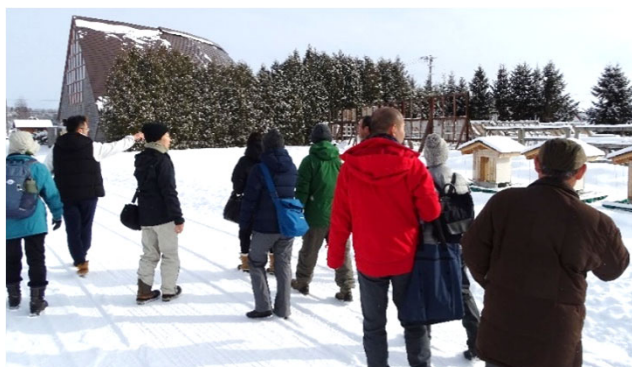
【暴露試験地見学の様子】

子どもたちを森林に誘う立場のサポーターの皆さんに、森林の産物である木材の利用についても理解を深めて頂きました。