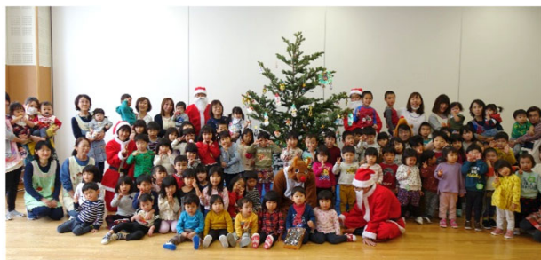
【クリスマスツリーセレモニー記念写真】

森で育ったトドマツのツリーが届けられるまでの紙芝居やツリーの飾り付けを通して、子どもたちに森林、樹木に親しんでもらいました。