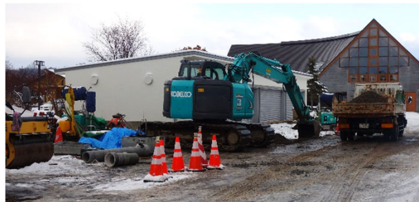
【庁舎裏 業務車庫・駐車場新設工事の様子】

現在、庁舎内の改装と、試験場側の車庫、駐車場の整備が行われています。大型ダンプも出入りするので、ご来場の際はご注意ください。