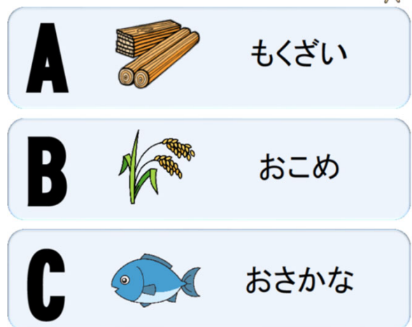
図2 木になるクイズ（イメージ）

りんさんしけんじょう なに けんきゅう 林産試験場は何を研究しているところでしょうか？