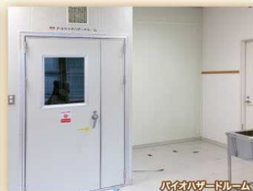
バスタブサードルーム