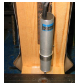
第 3 図 薄鋼板の座屈

3 図) によって接合部全体の剛性が低下するとともに、最大モーメントも鋼板の耐力によって決定される可能性が示唆された。したがって、従来法では釘本数に応じた接合性能を期待できたが、本接合法では薄鋼板の強度性能や断面性能に依存して接合部規模の上限が決定されると考えられる。この試験結果をもとに、薄鋼板の変形を考慮した設計計算方法を整理し、設計資料の整備を進めている。