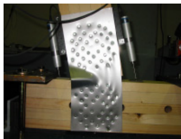
第 2 図 薄鋼板の変形