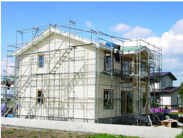
写真1 200mm断熱 新築 (2006年 鷹栖町)

最近では300mm断熱とか、500mm断熱といった話も聞きますが、実際、こういった住宅がどれくらい普及しているのか少し話しておきたいと思います。