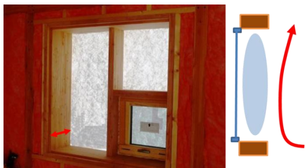
写真 3 300mm断熱住宅の木製サッシ (旭川)

写真3は旭川の300mm断熱住宅の現場を拝見させて頂いた時の写真です。この写真には、ポジティブな情報とネガティブな情報があるんですが、最初ポジティブな情報からお話しさせて頂きますと、柱にサッシが取りついていないのが分かります。いわゆる本棚のような木枠を作って、その中に木製サッシを納めています。