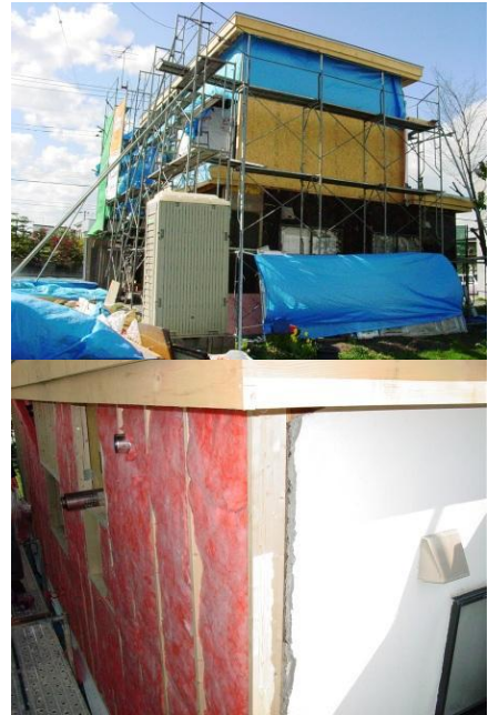
写真2 200mm断熱リフォーム (2006年旭川)

表1は、2010年に北総研で道内ビルダー2,000社に対して、「御社の住宅でどんな構法を採用していますか?」「断熱水準はどれくらいですか?」というようなアンケート調査の抜粋です。これを見ると、充填断熱が意外と多く、それも繊維系のものが多いということが分かります。充填断熱に外張を付加したのもかなり増えています。