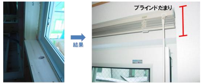
写真4 ドレーキップ窓（内倒し・内開き窓）とブラインド

左：105mm軸組柱に付加した60mm垂木に窓を固定（図2参照） 右：内倒し時の通風や付属物との干渉を避ける工夫