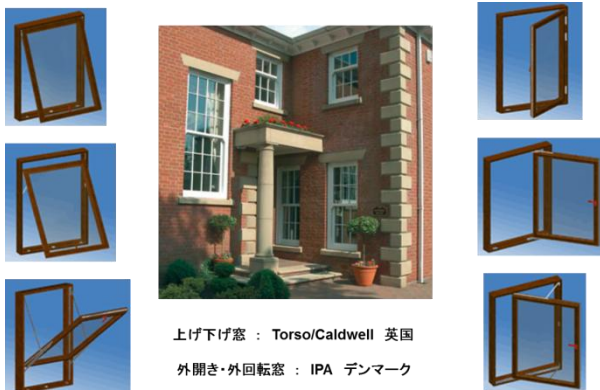
上げ下げ窓 : Torso/Caldwell 英国 外開き・外回転窓 : IPA デンマーク