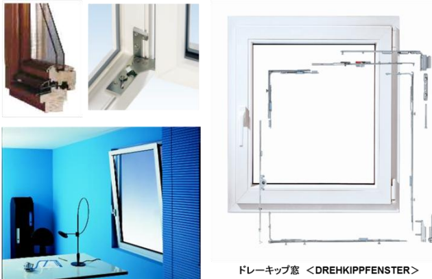
図4 ドレーキップ窓

語ではチルトターンと申します。日本ではドイツ語のままドレーキップで定着したものです。ドイツでは、住宅窓の9割以上がドレーキップであるのが実態です。障子の全周に金物を巡らして、ハンドルひとつの操作で、内開き(ドレー)と内倒し(キップ)の使い分けができ、閉めた状態では枠の四周に設置した締め点が有効となり、障子を面として締め込みます。このような開閉機能を有するのは、金物というメカを搭載した窓だからということが言えます。