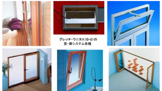
図3 独グレッチ・ウニタス (G・U) 社の窓システム

真ん中は上げ下げ窓の木製サッシです。白く塗っていますが木製サッシの写真です。左側の窓は、トップターンですとかトップスィングといわれる枠の外で回転する窓です。そして、右は外回転するサイドスウィングとかサイドターンといわれる窓仕様です。図3に示すのは、ドイツのグレッチ・ウニタス (G・U) 社の窓システムです。大型引戸のヘーベシーベ、パラレルスライド窓、横軸回転窓、これは高窓の換気用の内倒しのシステムですね。そして、ドレーキップ窓というものがございます。その応用で折れ戸システムもあります。