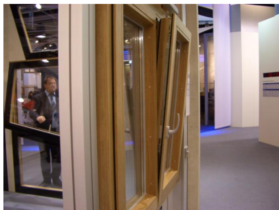
図7 パッシブハウス研究所仕様の窓

昨年のニュルンベルクで開催されたフェンスターパウでのG・U社の展示品の中からですが、日本でもその名を聞きますドイツ・パッシブハウス研究所仕様のドレーキップの両開き窓です。障子の見込みは110mm、Uw値は0.8未満というのが仕様になっています。このように、省エネルギー、CO 2 削減という試み、熱貫流率を小さくし断熱性能を上げる方向性は、いわば密封空間を求めるような動きですが、一方でまた必要とされる要件は、計画換気であり排気というもの的重要性です。