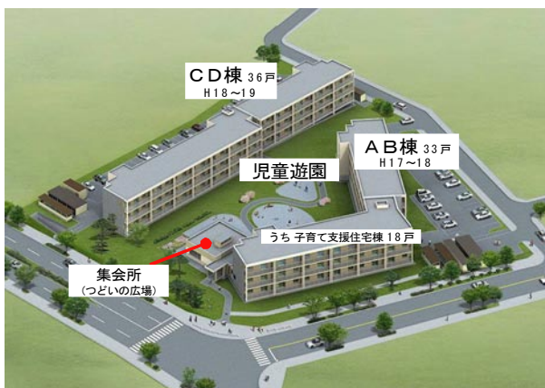
図1 子育て支援住宅のある道営住宅（根室市）

図1は根室市にある道営住宅です。通常の住棟と子育て支援住宅をつくりました。小学校に入る前の子供がいないと入居できない、かつ子供が全員中学校に入学すると退去しなければならない住宅です。つまりこの棟には常に子どもがいる、地域に一定の子どもが確保できます。この道営住宅では、単に子どものいる世帯を住ませるだけでなく、子育て支援拠点を整備しました。現在、子育て支援施設は大変な需要があります。