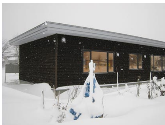
写真1 町営賃貸住宅（下川町）

このモデルを旭川で建てた場合、1戸あたり1,100万円くらいでできると思います。そうすると自治体収支の赤字の期間がほとんど無く供用できます。写真1が下川町で町営賃貸住宅として実際にこのモデルを活用している例です。