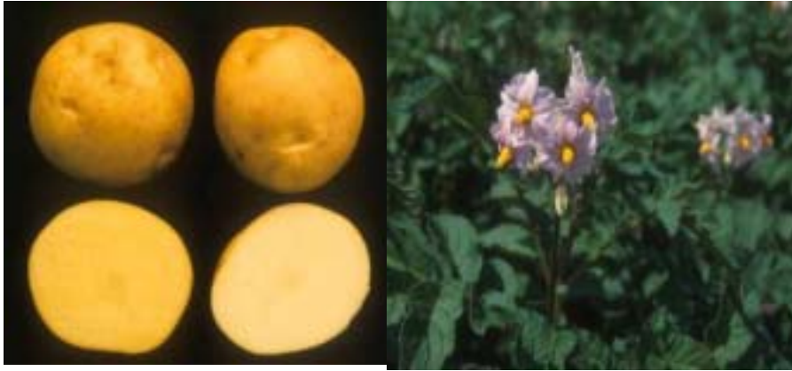
左「スタークイーン」 右「男爵薯」