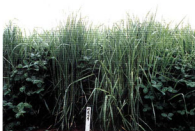
乾草草地の「アッケン」の草姿