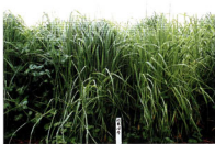
混播草地の「キリタップ」の草姿