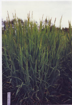
アイキップ単播の草姿