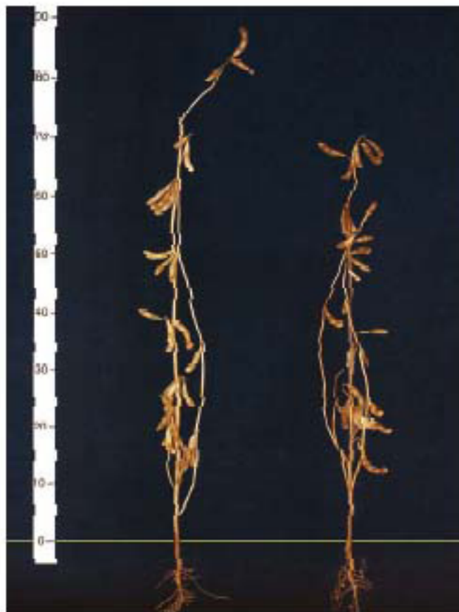
(左：「ゆきびりか」、右：「トヨコマチ」)