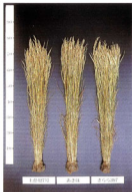
【ほしたまう】の穂姿 (写真左:「ほしたまう」、中:「あきほ」、右:「きらら397」)