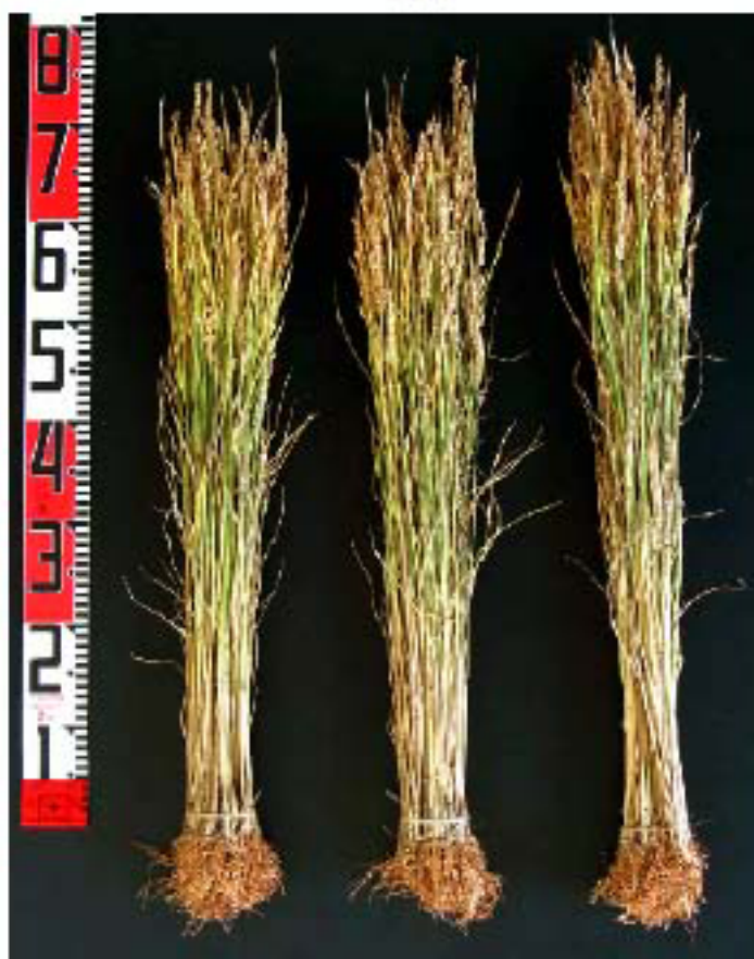
左「ほしまる」 中「ゆきまる」 右「ほしたろう」