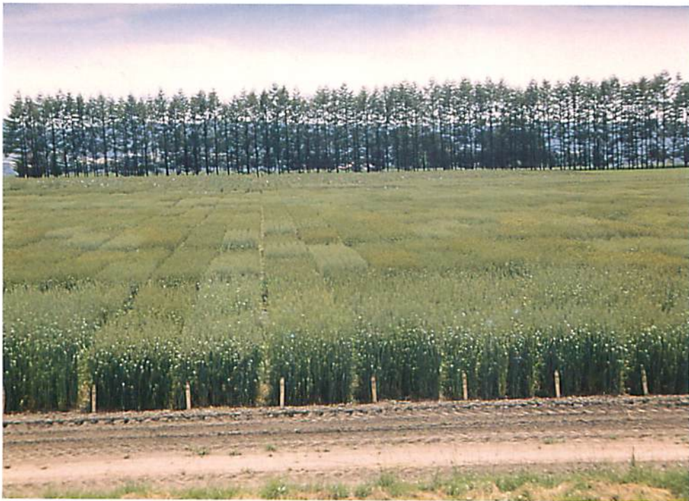
春播小麦出穂後 (北見農業試験場小麦育種指定試験地)