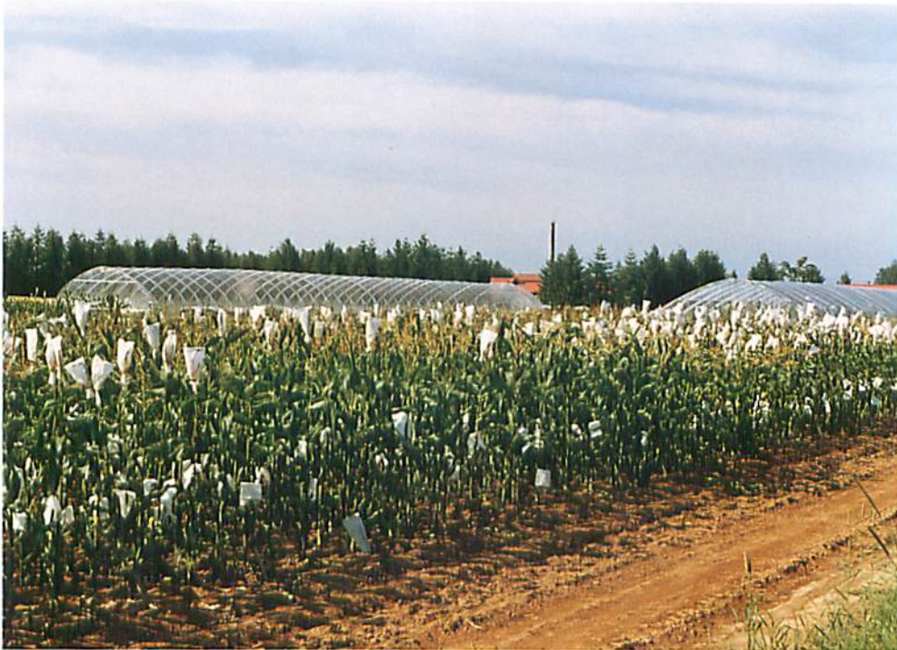
とうもろこし交配圃場 (十勝農業試験場とうもろこし育種指定試験地)