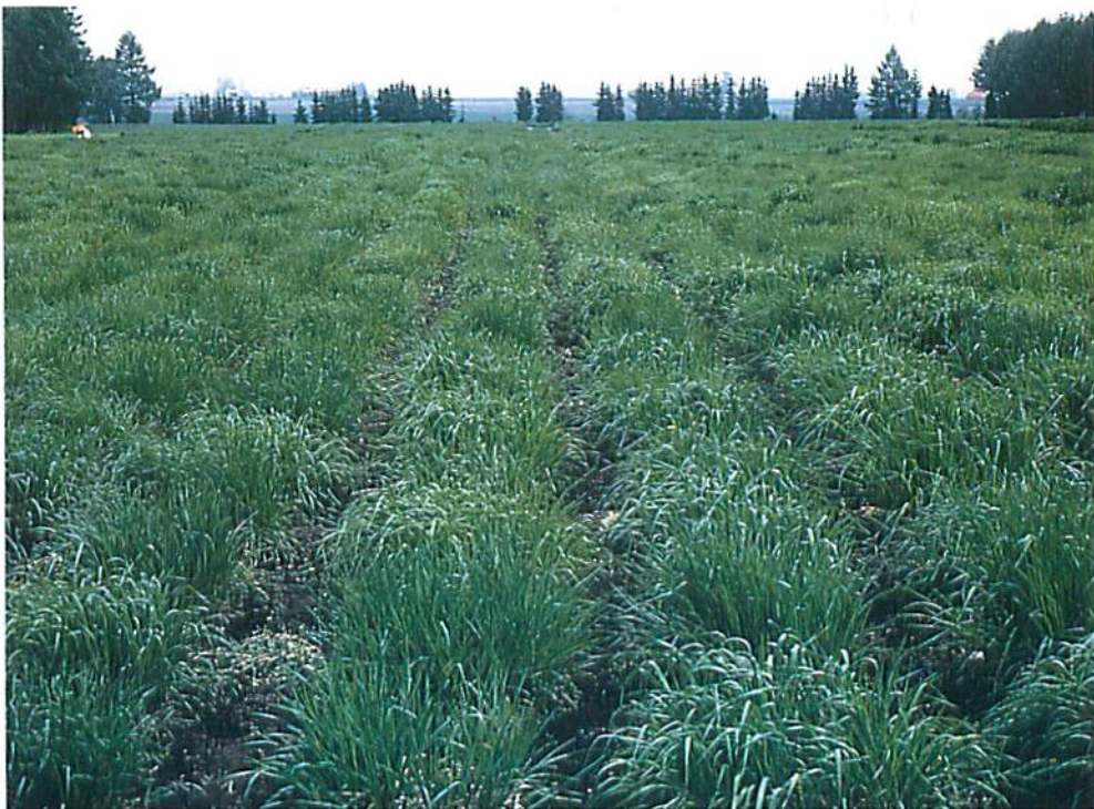
チモシー個体選抜圃場 (北見農業試験場牧草育種指定試験地)