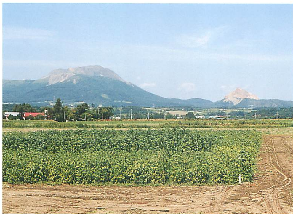
ダイズわい化病現地選抜圃場 (中央農場試験場大豆育種指定試験地)