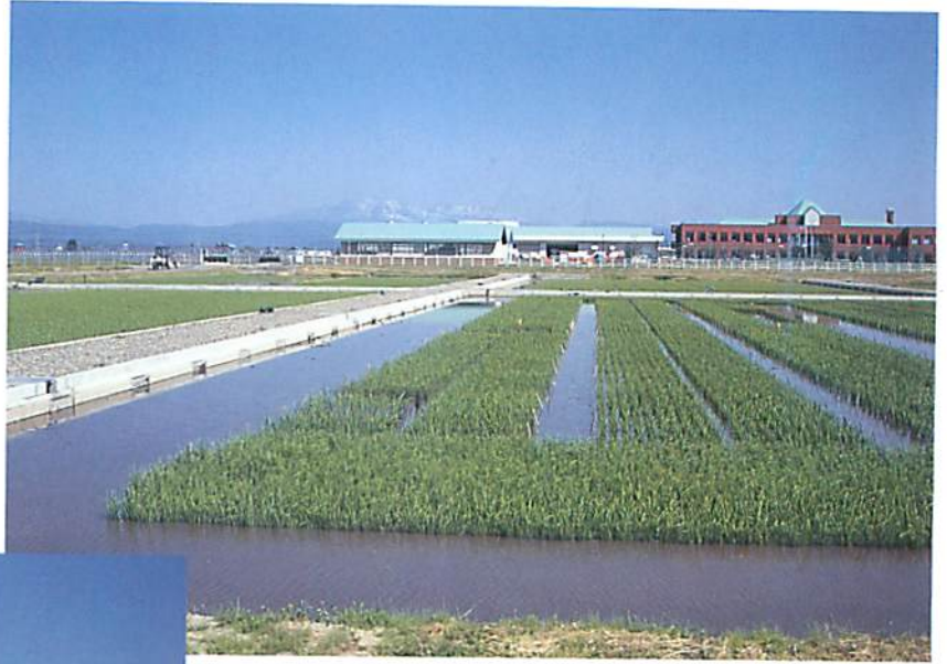
冷水掛け流し水田 (上川農業試験場水稲育種指定試験地)