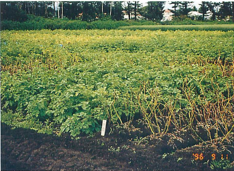
疫病無防除栽培における疫病圃場抵抗性品種の効果 左が抵抗性の「根育29号」、右が「農林1号」 (根釧農業試験場ばれいしょ育種指定試験地)