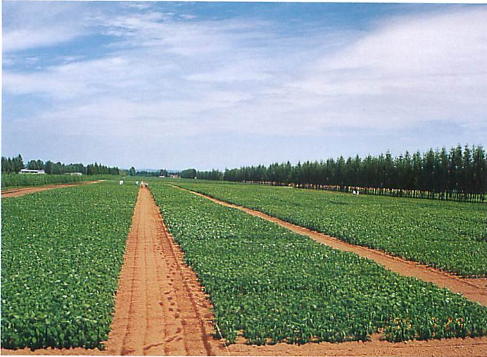
小豆育種試験圃全景 (十勝農業試験場小豆育種指定試験地)