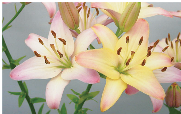
花色が変わる「きらりマジック」 （右：開花直後 左：開花2日後）