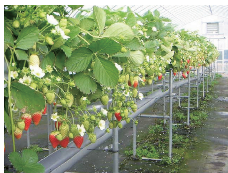
「なつじろう」の高設栽培の様子