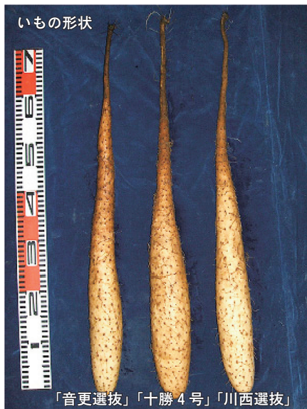
「音更選抜」 「十勝4号」 「川西選抜」