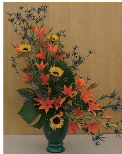
写真4 「ピカリ」を使ったフラワー アレンジメント