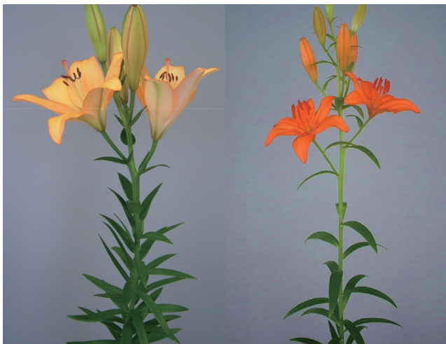
写真3 (左から) 比較品種「ロイヤルトリニティー」 および「きたきらり」の草姿