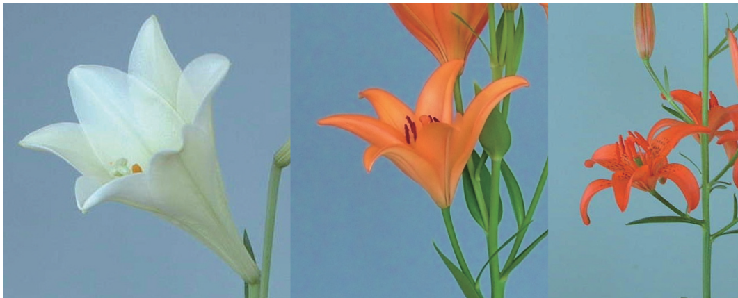
写真2 (左から)「ホワイトランサー」,「ピカリ」, チョウセンヒメユリの花形