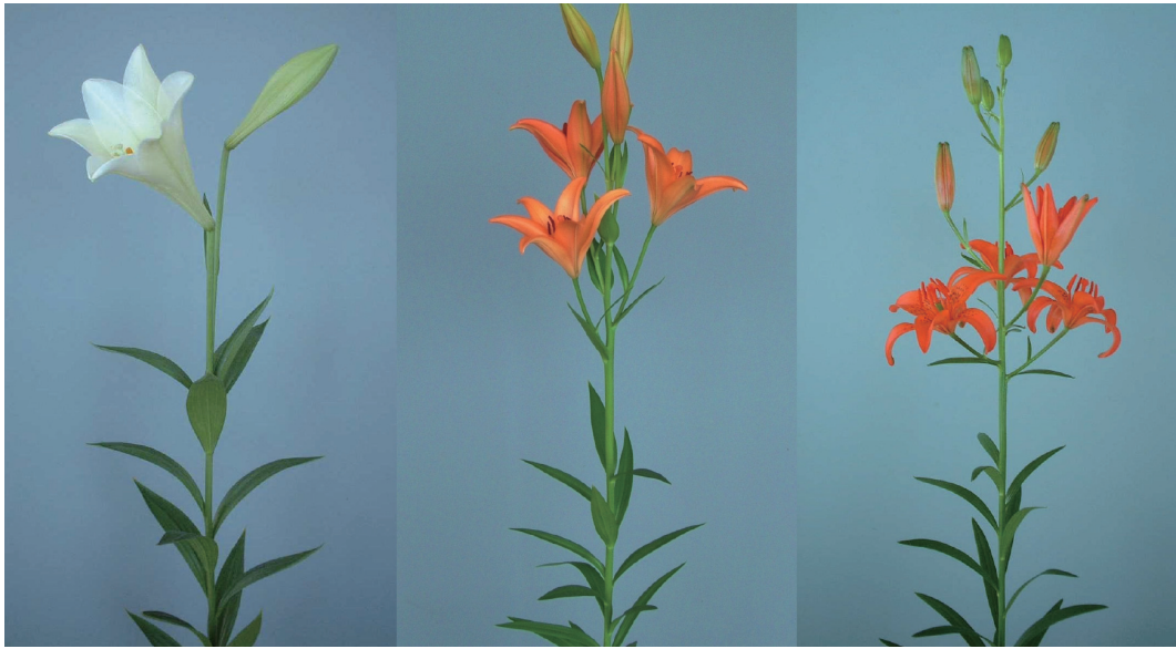
写真1 (左から)「ホワイトランサー」,「ピカリ」, チョウセンヒメユリの草姿