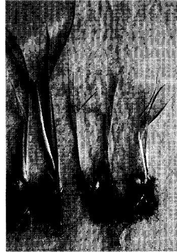
図版1 発病苗の腐敗症状 (葉鞘基部から褐色に腐敗する)

供試した病原細菌12菌株はいずれもグラム陰性、好気性で、極鞭毛を有し、グルコースを好氣的に分解した。黄色非水溶性色素および水溶性蛍光色素を産生せず、水溶性黄緑色色素を産生した。オキシダーゼ活性(コバックス)は陰性で、40℃で生育した。カタラーゼ、レシチナーゼ活性、硝酸塩還元、ゼラチンの液化は陽性であり、アルギニンジヒドロラーゼ、チロシナーゼ活性、スターチ加水分解、硫化水素産生は陰性であった。硝酸呼吸は弱陽性であった。ツイーン80加水分解は菌