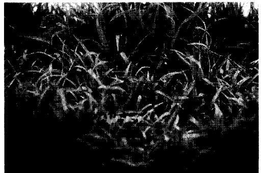
図版2 育苗箱内の坪枯れ症状 (腐敗苗を中心に坪状に発病が及ぶ)

株によって反応が異なった。また、ジャガイモ塊茎をわずかに腐敗させたが、タバコ過敏反応は陰性であった。グルコース、キシロース、フルクトース、ガラクトース、マンノース、D-アラビ