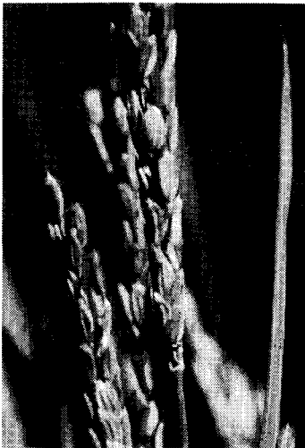
図版4 分離細菌の噴霧接種によるもみ枯症状

ノース, セロビオース, トレハロース, メリビオース, フライノース, イノシトール, グリセロール, マンニトール, アドニトールおよびエタノールから酸を産生したが, L-ラムノース, スクロース, マルトース, スターチおよびイヌリンから酸を産生しなかった。D-酒石酸塩, マロン酸塩, ケエン酸塩, 乳酸塩, L-アルギニン, \beta -アラニンおよびアスパラギンを利用したが, L-酒石酸塩, シトラコン酸塩, ニコチン酸塩, メサコン酸塩, 安息香酸塩およびレブリン酸塩を利用しなかった。ラクトースからの酸産生は菌株によって異なった。また, 松田らの培地 12)・13) 中にシュウ酸カルシウム結晶を形成した(図版5)。