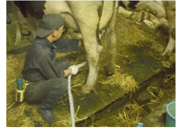
写真1 乳頭清拭装置の外観 (左) と清拭作業 (右)