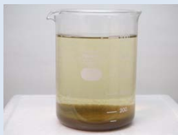
写真2 凝集沈殿処理直後