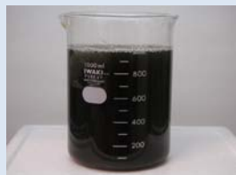
凝集沈殿処理 (凝集剤+攪拌)