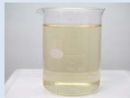
写真3 活性汚泥処理後