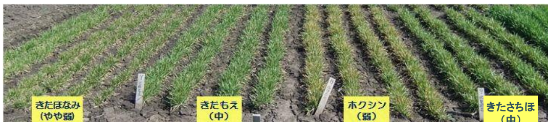
写真-2 縞萎縮病抵抗性の品種間差（2010/4/26・A市多発圃場）

■「きたもえ」と比較した特徴は次の通りです。稈長はやや長く、穂長は長く、穂数は同程度です。子実重は育成地（北見農試）でやや少ないですが、その他の試験地では「きたもえ」とほぼ同程度です。品質取引項目のひとつである容積重が大きい特徴があります。縞萎縮病に対する抵抗性は「きたもえ」と同程度の“中”で、北海道の日本めん用品種では最も強い抵抗性を有します（表-1）。