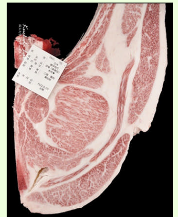
共励会（肉のコンテスト）で最優秀賞を受賞しました。