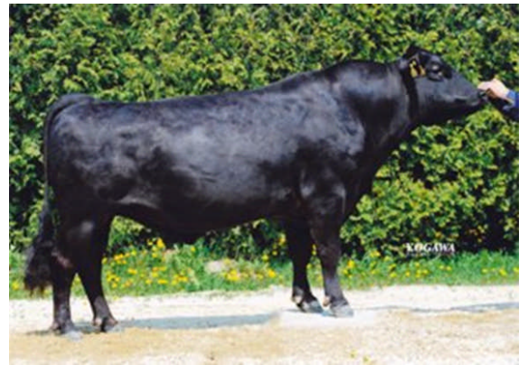
「勝早桜5」 血統 勝忠平×安平×隆桜 平成18年生 北海道産 審査得点 83.3

そこで、肉量、肉質、子牛の発育および雌産子の体型に優れた種雄牛「勝早桜5」を作りました。