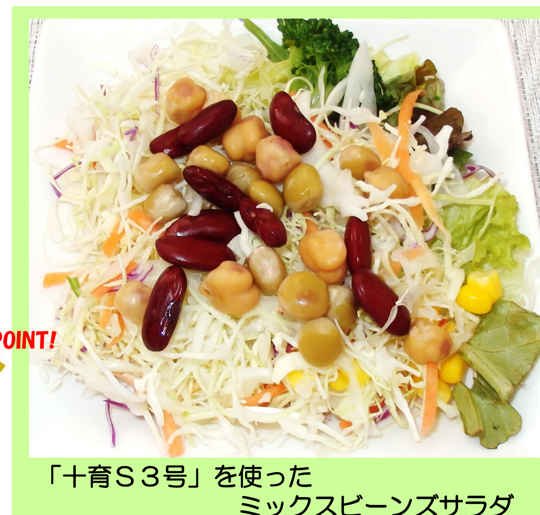
「十育S3号」を使った ミックスビーンズサラダ