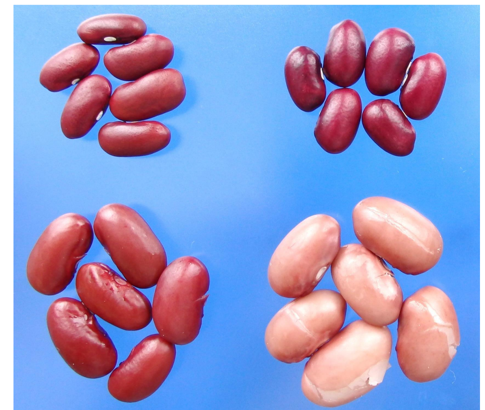
煮熟前(上)と煮熟後(下)の外観