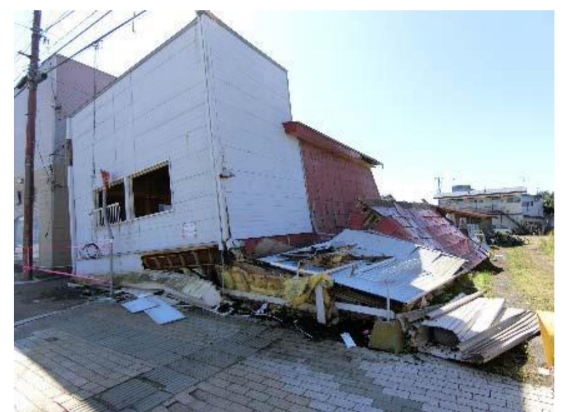
写真1 店舗併用住宅被害