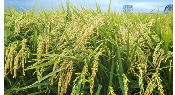
たわわに実った「空育195号」

中食・外食向けの北海道米「きらら397」「そらゆき」と比べて 長所：①多収である。②いもち病抵抗性が強い。 短所：玄米品質がやや劣る。