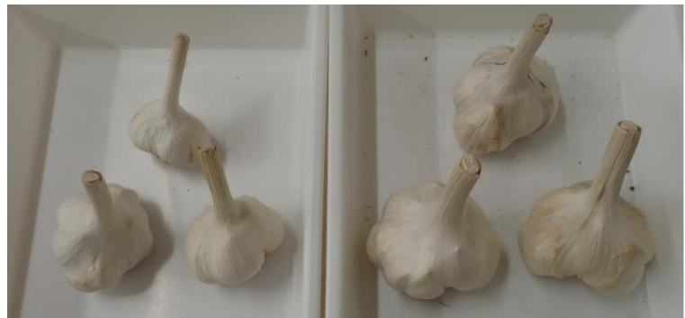
LYSV感染株 平均一球重68.0g、球径6.4cm (推定収量*: 952kg/10a)