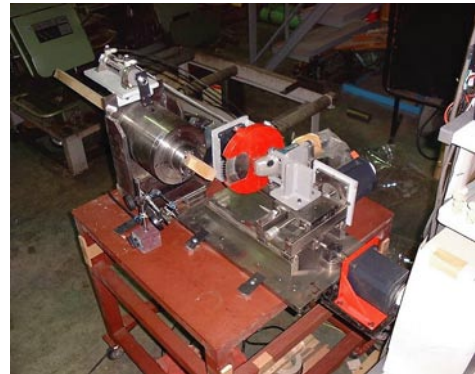
写真2 NC木工旋盤の全景

開発したNC木工旋盤の全景を写真2に、構成を図2に、仕様を表1に示します。C軸上で回転する材料は、X軸とZ軸からなる平面内を自由に運動するチップソーによって加工されます。