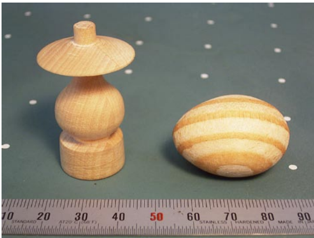
写真1 加工例 (左: 木のランプ, 右: 木の卵)

もうひとつの“木のランプ”は直径27mm高さ45mm、加工時間は約3分です。直線と円弧を組み合わせてデザインしました。薄い傘の外周部分の厚みは約0.5mm、一番細い部分では直径6mmです。