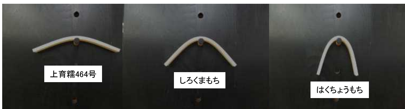
写真 上川農試産米による曲がり法の結果 (平成 24 年)

注 1) 「はくちょうもち」を 0 としたときの評価値 注 2) 平成 22-24 年：普及見込み地帯産米 17 回平均