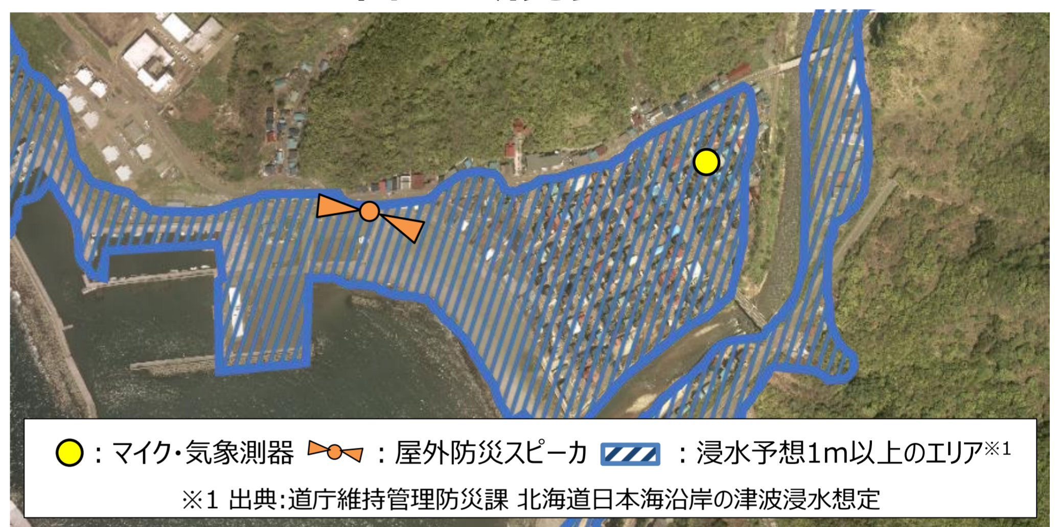
図2 屋外防災スピーカと測定機器の設置位置の関係