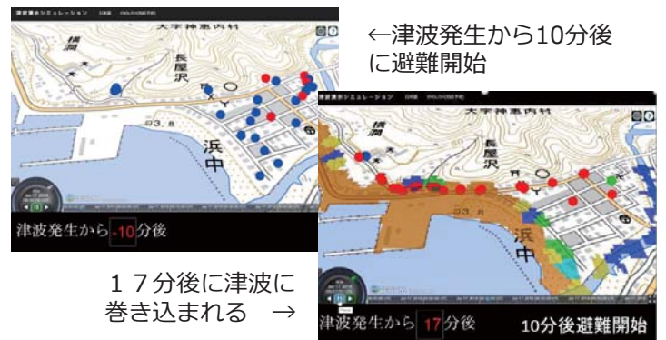
図3 避難行動可視化ツールの開発