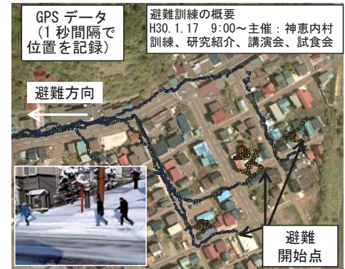
図2 避難訓練による避難速度の調査