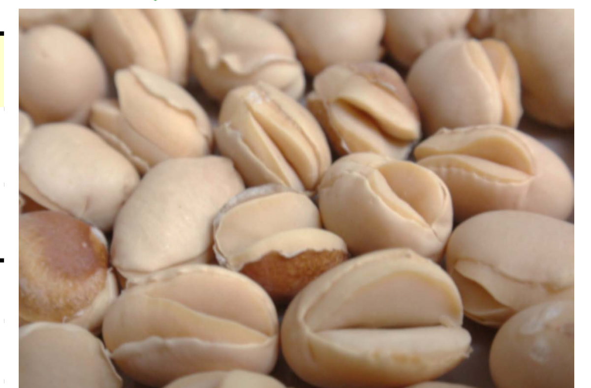
低温による裂開粒被害