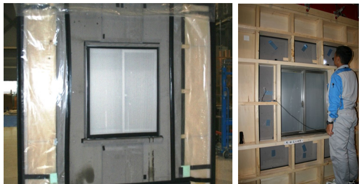
図2 開口部周り部材の水密試験