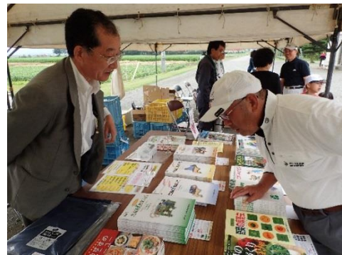
北海道農業改良普及協会による 農と食の書籍販売