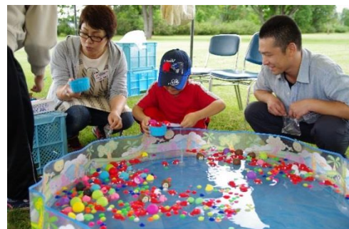
スーパーボールすくい