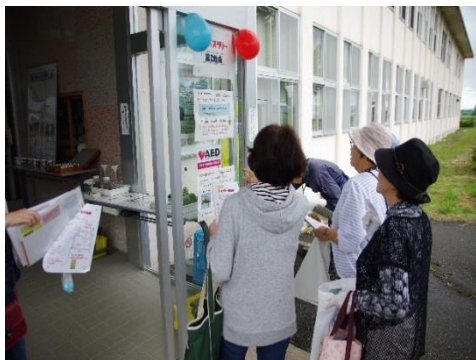
クイズラリー、7カ所を廻ります