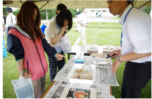
網走水試によるホタテガイ解剖デモ