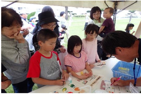
トマト，玉ねぎ，スイートコーン， どれが一番甘いかな？