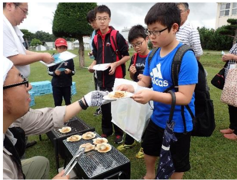
炭火焼きのホタテだよ