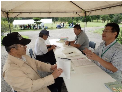
畑作園芸相談、悩みにお答えします