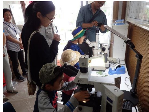
アブラムシを顕微鏡で観察