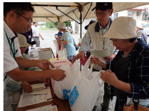
おみやげに馬鈴しょをどうぞ