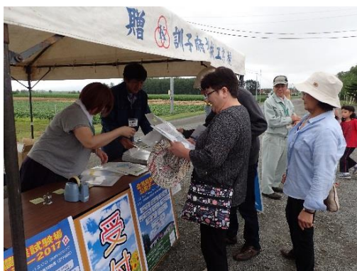
受付でパンフをどうぞ