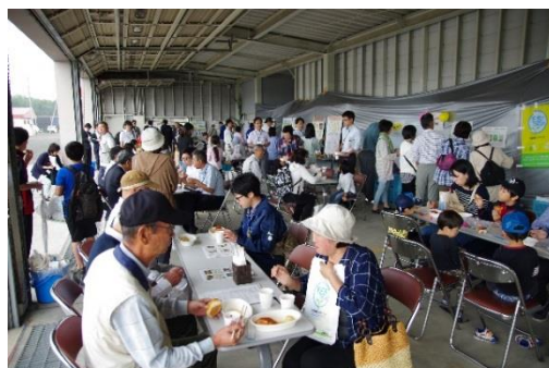
試食会場は大賑わい