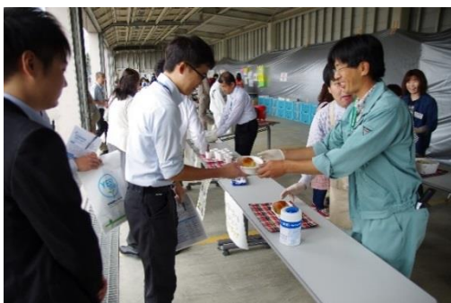
どうぞ、お召し上がり下さい