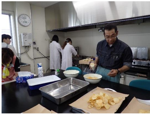
ポテトチップス、作っています