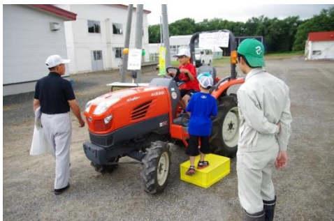
トラクターに乗ってご満悦