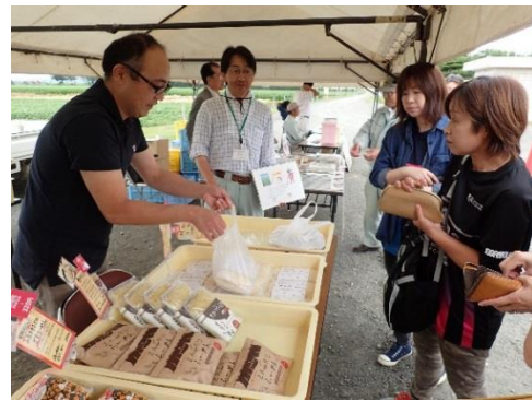
ツムラによる小麦加工品の販売