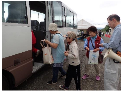
ほ場見学バスツアーに出発！