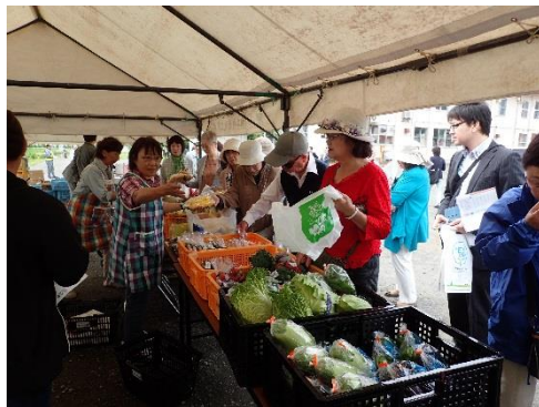
夢ミールによる野菜販売