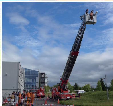
しゃ の はしご車に乗ってみよう！