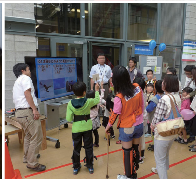
つなみ たか はや たいけん 津波の高さと速さを体験しよう！