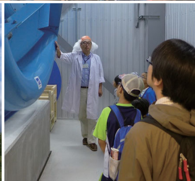
けんきゅうじょ たんけん 研究所を探検してみよう！