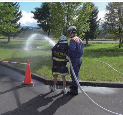
ひ け くんれん たいけん 火を消す訓練を体験しよう！